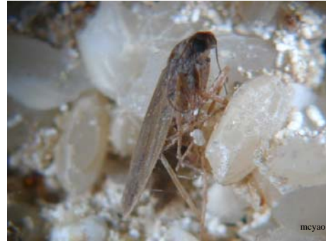
外米綴蛾 Corcyra cephalonica S. 糙米、白米主要害蟲。