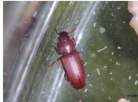
擬穀盜 Tribolium castaneum H. 進口糙米、麵粉類主要害蟲。