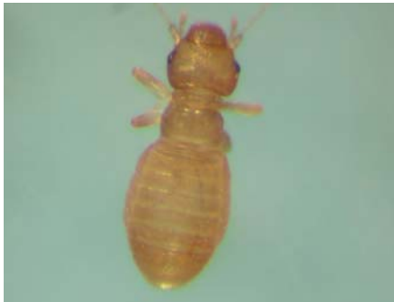
茶蛀蟲 Liposcelis divinatorius M. 進口糙米在高濕環境極易發生之害蟲。