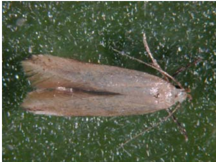
麥蛾 Sitotroga cerealella O. 稻穀主要害蟲，初期為害。