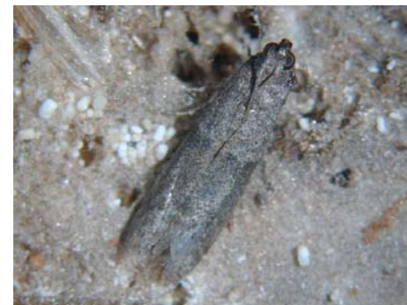
粉斑螟蛾 Ephestia cautella W. 進口糙米、白米、蒜頭主要害蟲。