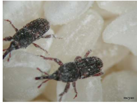
米象 Sitophilus oryzae L. 或玉米象 Sitophilus zeamais M. 糙米、白米最主要害蟲。