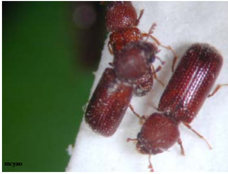
穀蠹 Rhyzopertha dominica F. 稻穀最主要害蟲，初期為害。